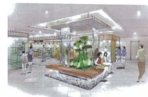
6階レストランフロア 環境イメージ