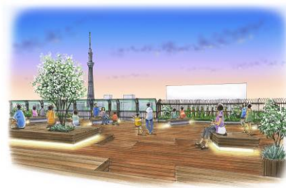
屋上庭園 7階・8階イメージ