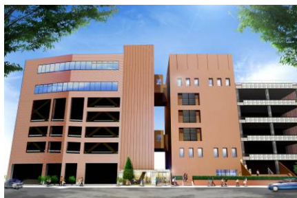
アトレ亀戸外観イメージ