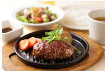
[6階 いしがまやハンバーグ]