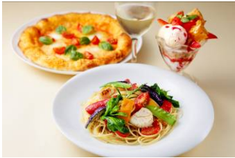
[6階 トウ・ザ・ハーブズ]