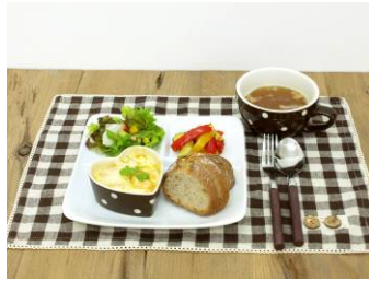
[4階 3 Coins]