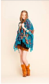
[4階 ABC マート]