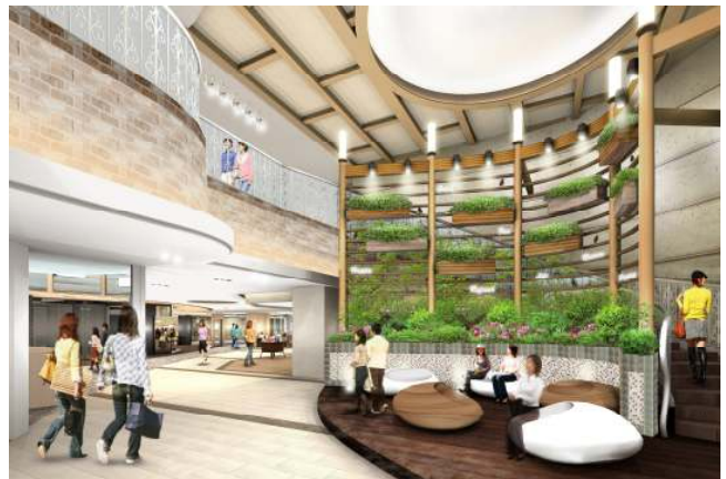
3F いろどりステージ